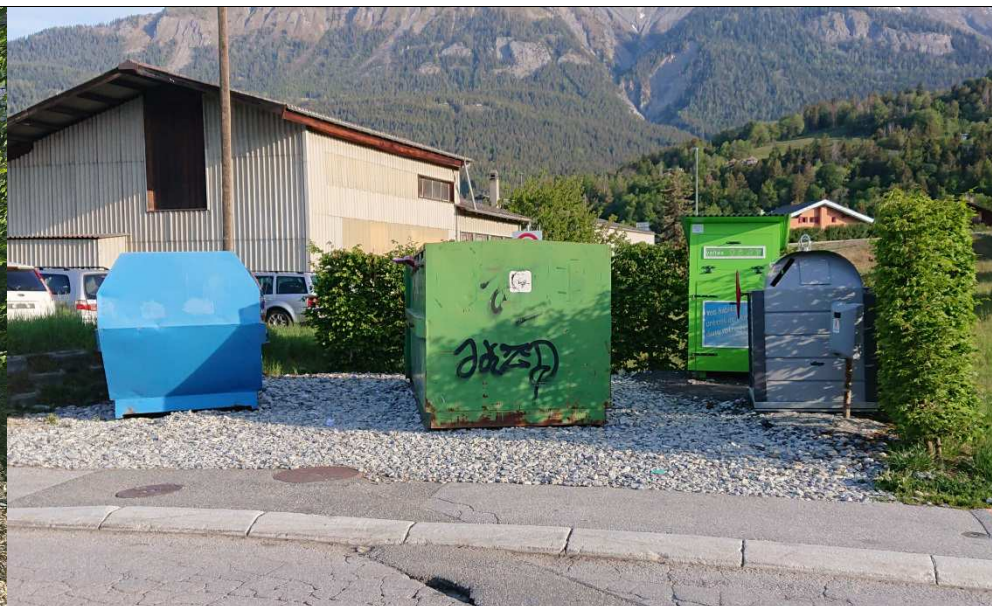
Aménagement des Ecopoints