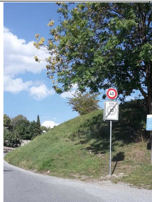
Signalisation à la route de l'Etang