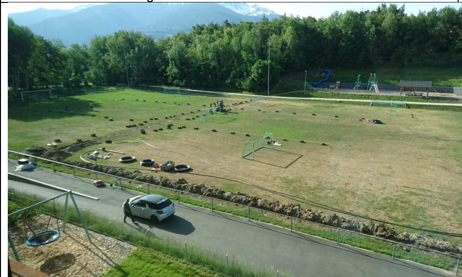
Arrosage automatique du terrain de foot du centre scolaire