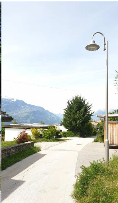
Modernisation de l'éclairage à la rue du Golf