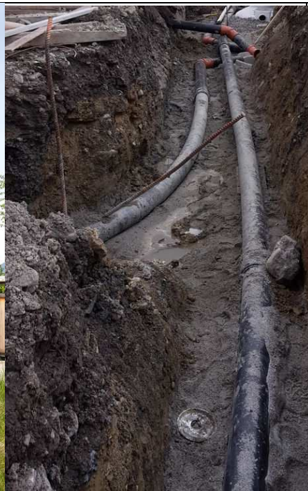
Déplacement d'une conduite d'irrigation