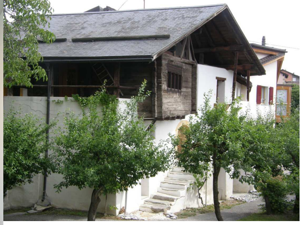
Achat du Bougan