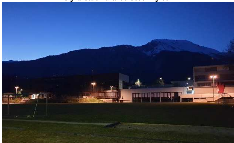
Eclairage du centre scolaire