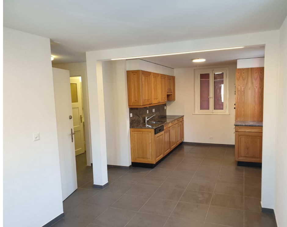
Rénovation de l'appartement – Maison rue du Château 3