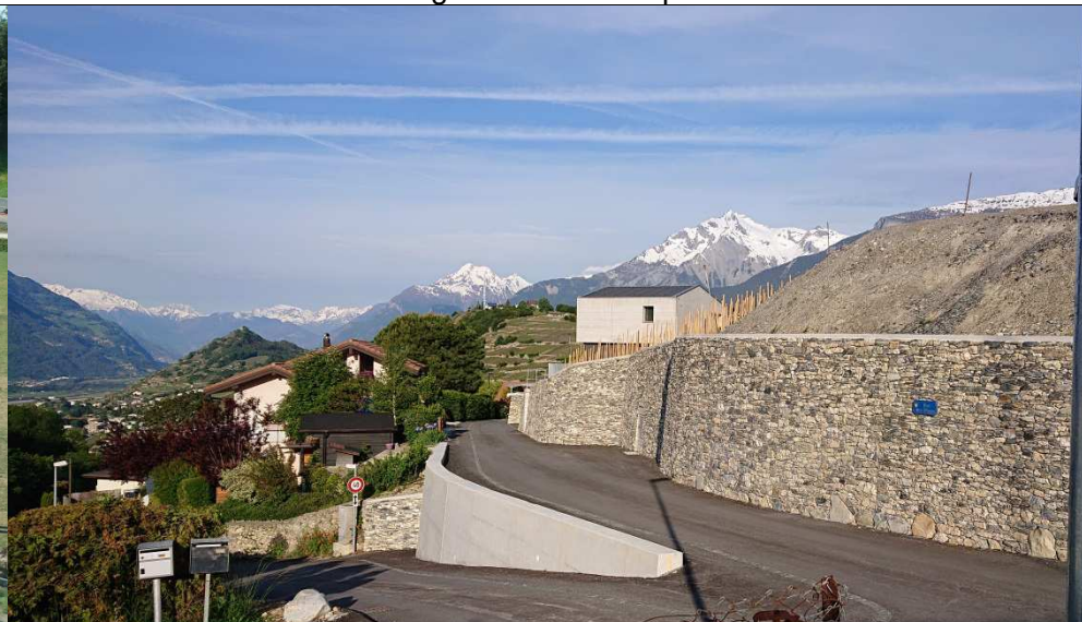
Aménagement de la route des Places