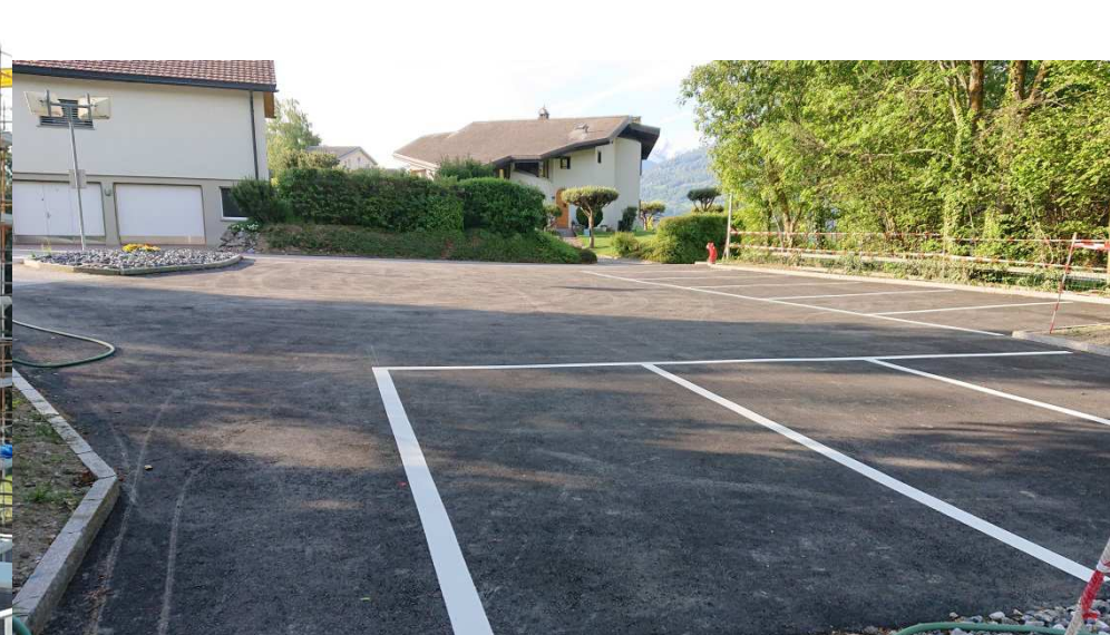
Place de parcs rue de Coméraz (ancienne Ludothèque)