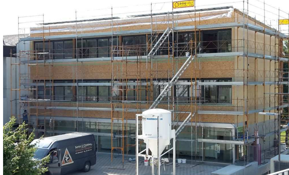
Assainissement de l'annexe de l'ancien centre scolaire