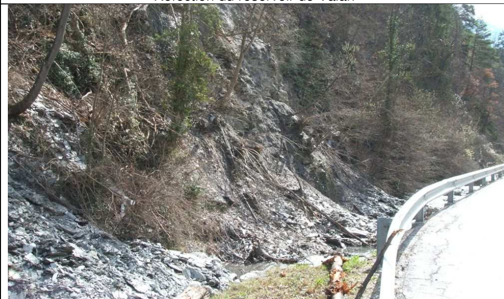
Sécurisation de la Sionne