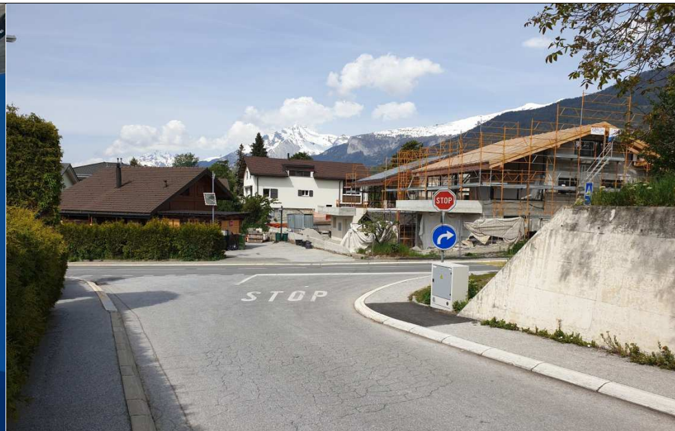
Signalisation à la rue Sous l'Eglise