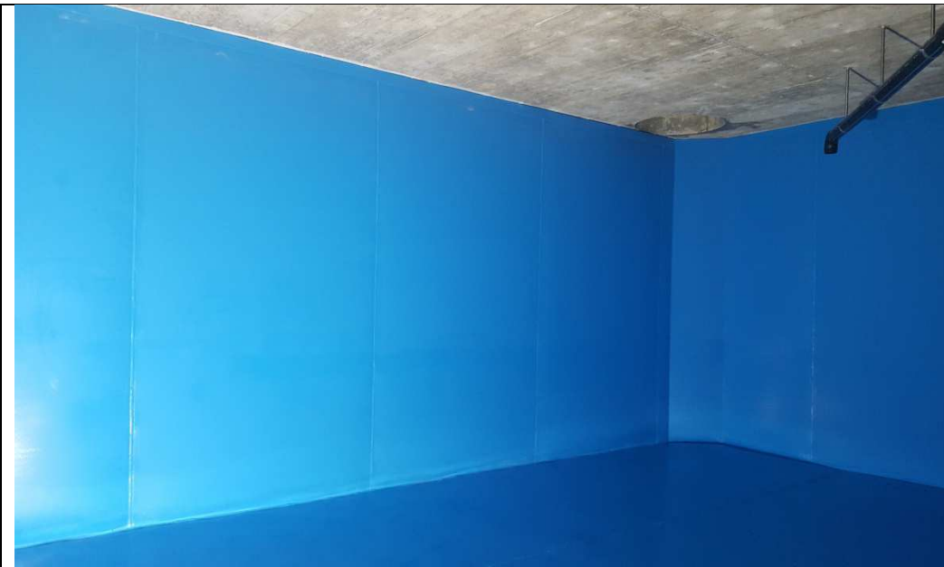
Réfection du réservoir de Valan